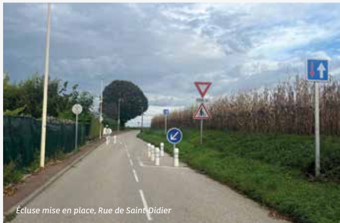
Ecluse mise en place, Rue de Saint-Didier

En concertation avec les habitants du quartier (réunion publique du 26/09/2024), nous avons prévu une phase test de 2 mois , qui devrait s'achever fin novembre et permettre de :